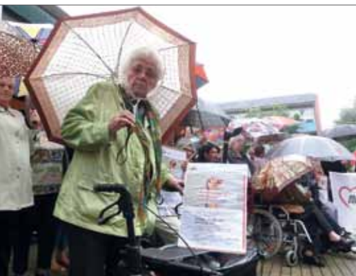
Bild oben: Im Juli letzten Jahres protestierten die Besucherinnen und Besucher der AWO Begegnungsstätte in Eick-West bereits gegen die damals geplanten Kürzungen. Nun droht erneut die Schließung.