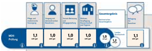
Ergebnis der aktuellen MDK-Prüfung

Essenberger Str. 6 h, 47441 Moers - Tel.: 02841/88022-00 - Fax: 02841/88022-40 s2a@awo-kr-westel.de - www.awo-kr-westel.de