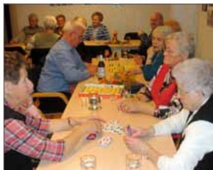
Bild unten: Die Geburtstagsgäste beim (wahlweise) Mensch-Ärgere-Dich-Nicht-Spielen/Klönen/beliebten Skip-Bo-Spielen

Vierteljährlich veranstaltet der AWO Ortsverein Voerde-Möllen für seine Mitglieder eine Geburtstagsfeier. Die im Oktober, November oder Dezember geborenen wurden am 31. Oktober zu einer gemütlichen Feier in die AWO-Begegnungsstätte an der Schlesierstraße eingeladen. Dabei fehlte es natürlich nicht an frisch gebackenem Kuchen und Kaffee. Bei Skip-Bo, Mensch-Ärgere-Dich-Nicht und gemeinsamen Klönen klang der Nachmittag in gemütlicher Runde aus.