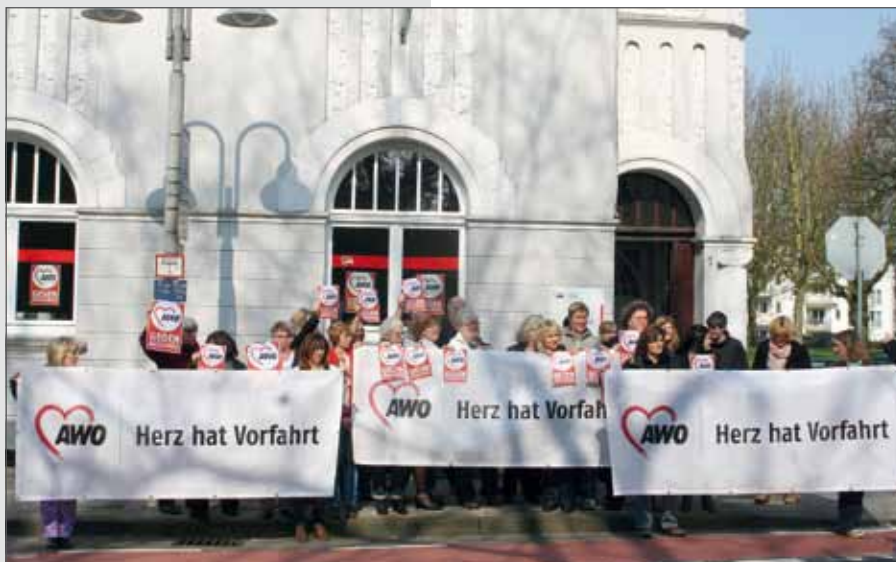
Bild: Bereits am 21. März 2012 beteiligten sich auch die Mitarbeiterinnen und Mitarbeiter der Geschäftsstelle in Rheinberg an der bundesweiten Aktion.

Info: Die AWO ist, gemeinsam mit mehr als 70 bundesweiten Organisationen und Einrichtungen, auch 2014 Kooperationspartner bei den Internationalen Wochen gegen Rassismus, die vom 10.–23. März 2014 stattfinden.