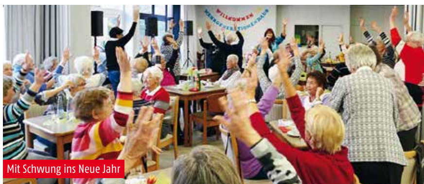
Mit Schwung ins Neue Jahr

Im Jahr 2020 geht es im AWO Kreisverband weiter mit den Jubiläumsfeiern. Verschiedene Ortsvereine im Kreisgebiet feiern ihr langjähriges Bestehen beziehungsweise ihre Wiedergründungen nach dem Zweiten Weltkrieg – darunter 75 Jahre AWO Ortsverband Moers und AWO Ortsverband Moers-Rheinkamp.