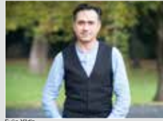
Eyüp Yildiz stellvertretender Bürgermeister