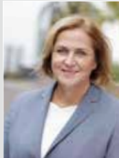
Michaela Esloffel Bürgermeisterin