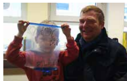
Bild oben: Vater und Sohn erstellen einen Wasserkreislauf

Flüssen gibt. Sie haben gelernt, dass die Sonne das Wasser verdunsten lässt und dadurch Wolken am Himmel entstehen, aus denen schließlich Regen fällt. Eine Verbindung zum Alltag fanden die Kinder auch: „Das sieht ja so aus wie zu Hause, wenn Mama Nudeln kocht!“ Ihre Forschungsergebnisse über das Wetter wollten die Kinder natürlich auch ihren Eltern zeigen. Bei einer corona-konformen Elternaktion demonstrierten sie, was sie die letzten Wochen über Regen gelernt haben. Gemeinsam stellten sie Miniatur-Wasserkreisläufe her. Eine beliebte Möglichkeit war eine Tüte, in der das Wasser von der Sonne