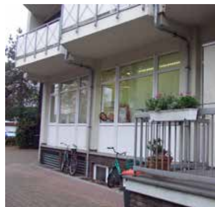
AWO Begegnungsstätte Markgrafenstraße

Im Dezember 2021 kam es für die AWO zum ersten Spatenstich im Rathausquartier in Kamp-Lintfort. Mitten im Stadtzentrum begann das Bauprojekt des AWO Kreisverband Wesel e.V. für insgesamt 21 Senior*innen-Wohnungen. Die Fertigstellung ist für Herbst 2023 geplant. Für den AWO Ortsverein Kamp-Lintfort begann damit ebenfalls eine neue Zeitrechnung. Im Erdgeschoss des Gebäudes wird auf rund 170 qm 2 eine neue