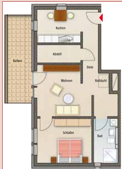
Grundriss einer grossen Wohneinheit (ca. 79 qm)