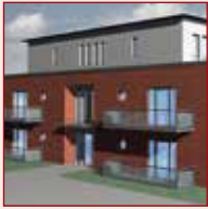
Perspektive Eingang Haus 2