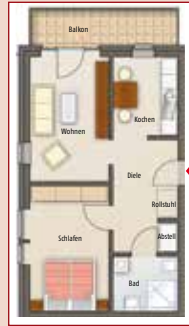
Grundriss einer kleineren Wohneinheit (ca. 60 qm)