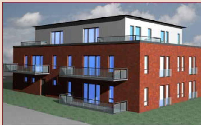
Perspektive Rückseite Haus 2