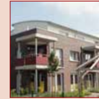
ServiceWohnen in Wesel